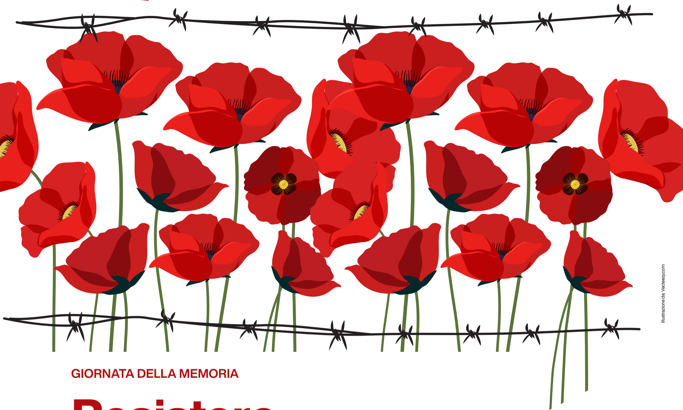
Illustrazione da Vecteezy.com